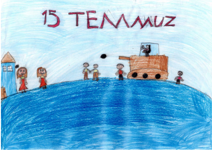
Meliha Nida TAŞÇI 4/A