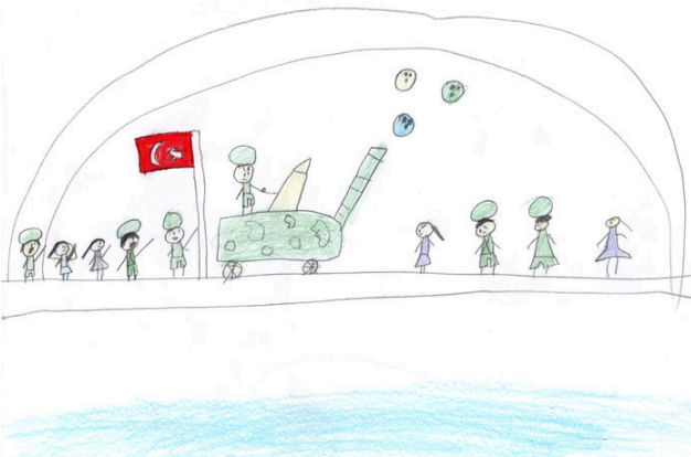
Nedime Zeynep DURMAZ 4/A