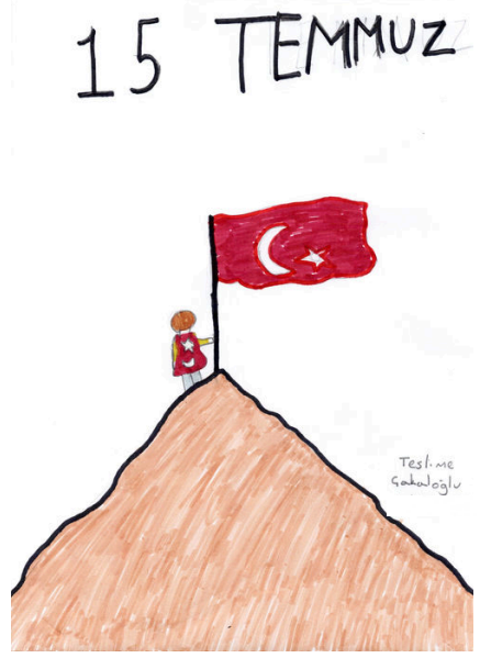
Teslime ÇAKALOĞLU 7/A