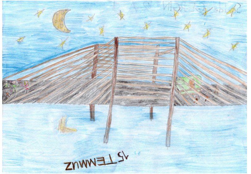
Sacide GERGİN 4/A