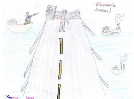
Yağmur KAYA 7/A