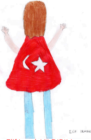
Elif İrmak YILDIRIM 7/A